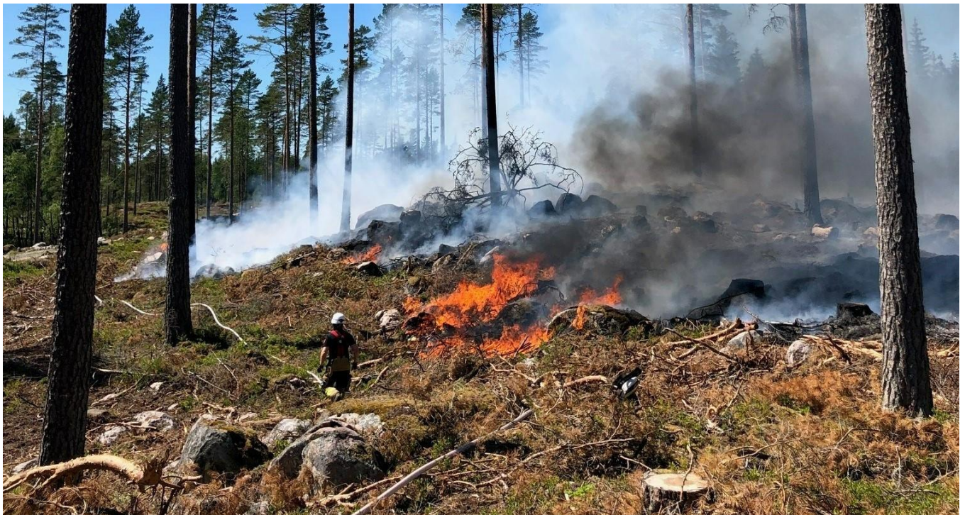
Skogsbrand på Oppunda häradssällmanning 2021.

Under året bjöd Oppunda in sina delägare till en skoglig exkursion. Vi åkte bland annat för förbi brandområdet från 2021. Det var en uppskattad exkursion som fyllde två bussar med delägare. Vi avslutade med lunch på Ericsberg.