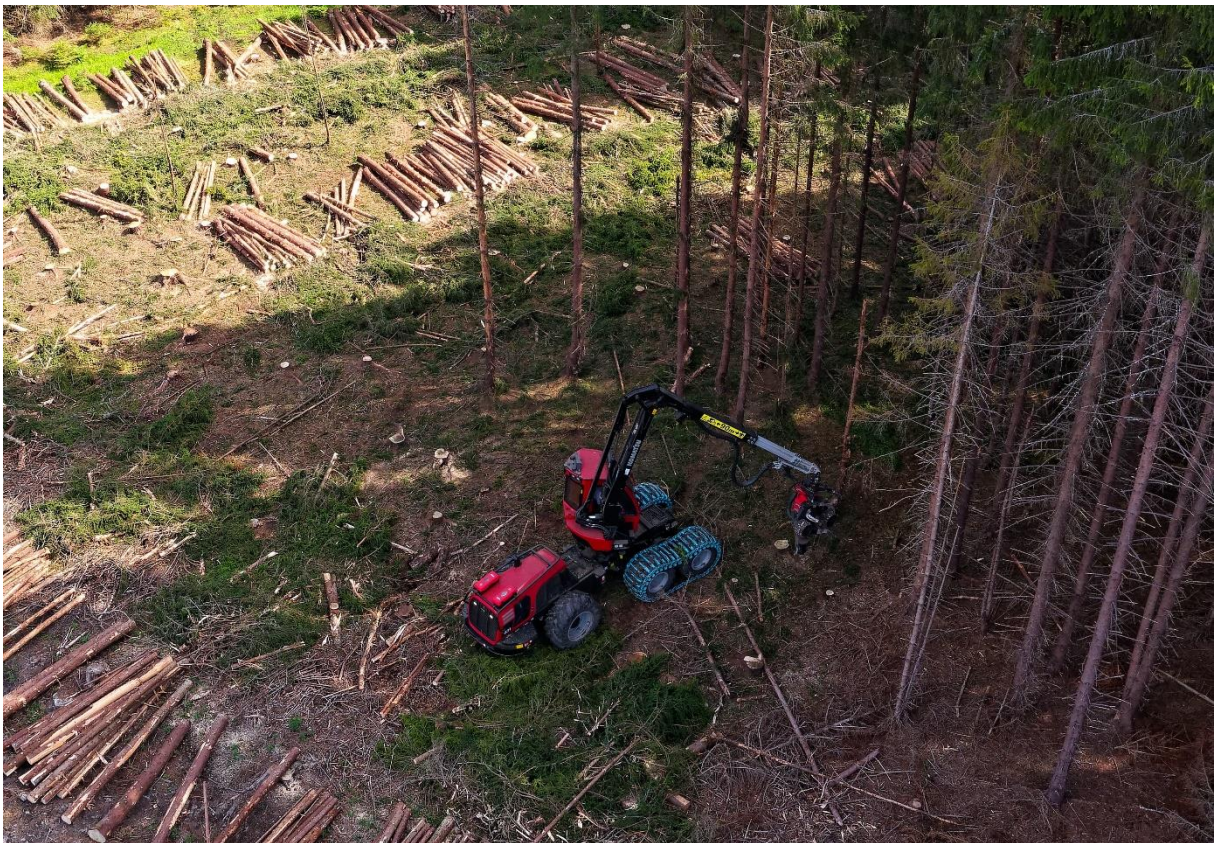
En av Häradskogs skördare.

Det var i slutet av februari som Ryssland inledde sin invasion av Ukraina. Vi fick ett nytt krig i Europa och effekterna av kriget skulle påverka oss under hela året. Europa och övriga Västvärlden inledde omgående sanktioner mot Ryssland. Sanktionerna gjorde att energipriserna steg snabbt och en redan stigande inflation fick ordentlig fart. Sanktionerna har även påverkat marknadssituationen för virke tack vare bojkott av ryskt virke.