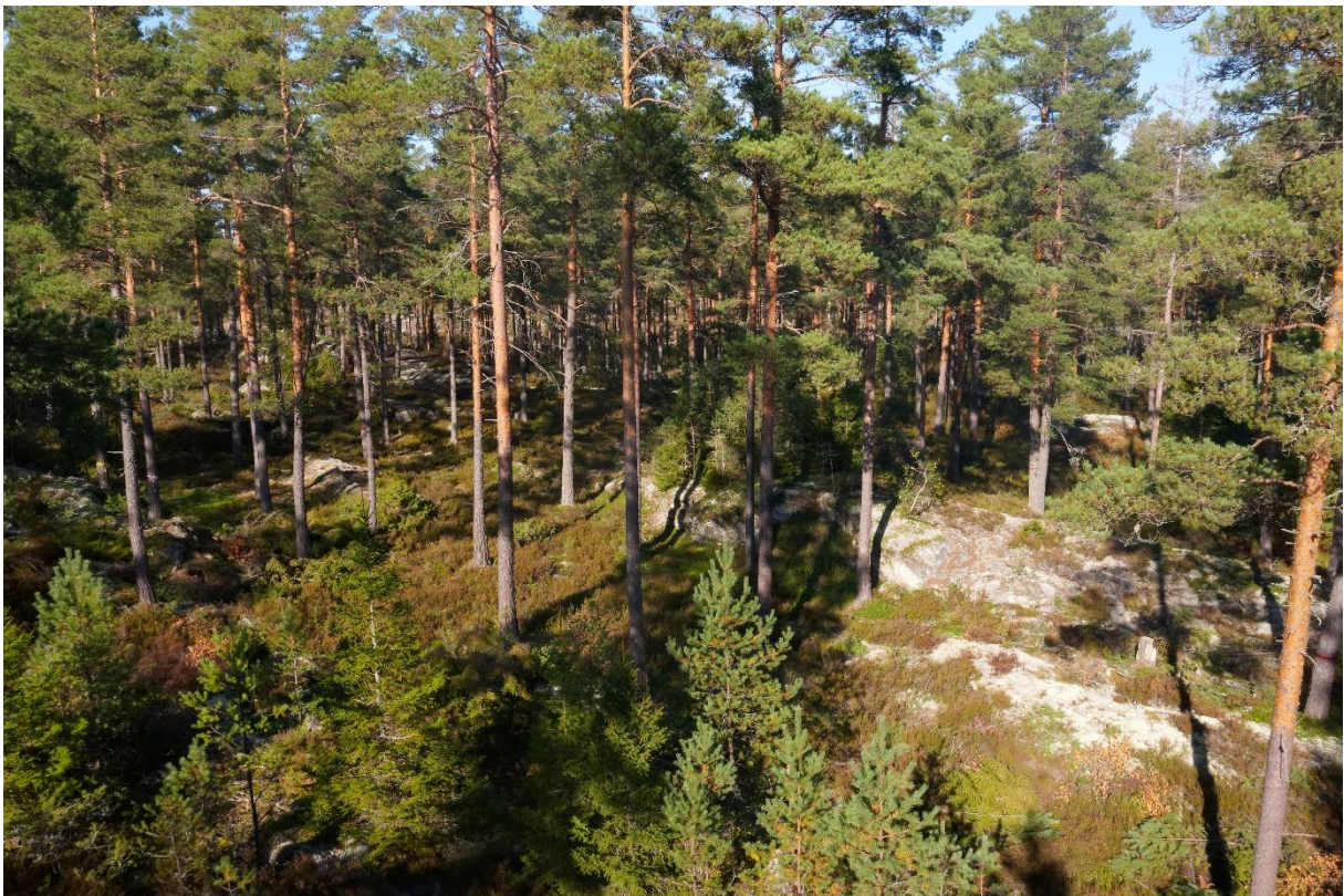
Tallskog hos en Häradsallmanning

För sågverken började året med samma goda konjunktur som året innan. Priserna för sågade trävaror var bra och leveranserna goda. När kriget bröt ut kom en förväntan i Europa att det skulle uppstå en brist på trävaror när de ryska varorna skulle bojkottas. Köparna började köpa på sig trävaror för att inte stå utan. Allt eftersom kriget fortled och inflationen började bita sig fast, påbörjades räntehöjningar runt om i världen i syfte att bromsa inflationen. Med stigande räntor under året har bostadsbyggandet bromsat in i Europa. Och med det har konjunkturen för sågverken försämrats under året.