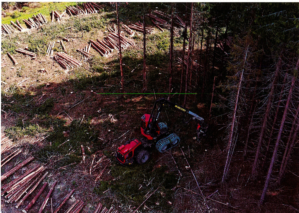
En av Häradskogs skördare.

Det var i slutet av februari som Ryssland inledde sin invasion av Ukraina. Vi fick ett nytt krig i Europa och effekterna av kriget skulle påverka oss under hela året. Europa och övriga Västvärlden inledde omgående sanktioner mot Ryssland. Sanktionerna gjorde att energipriserna steg snabbt och en redan stigande inflation fick ordentlig fart. Sanktionerna har även påverkat marknadssituationen för virke tack vare bojkott av ryskt virke.