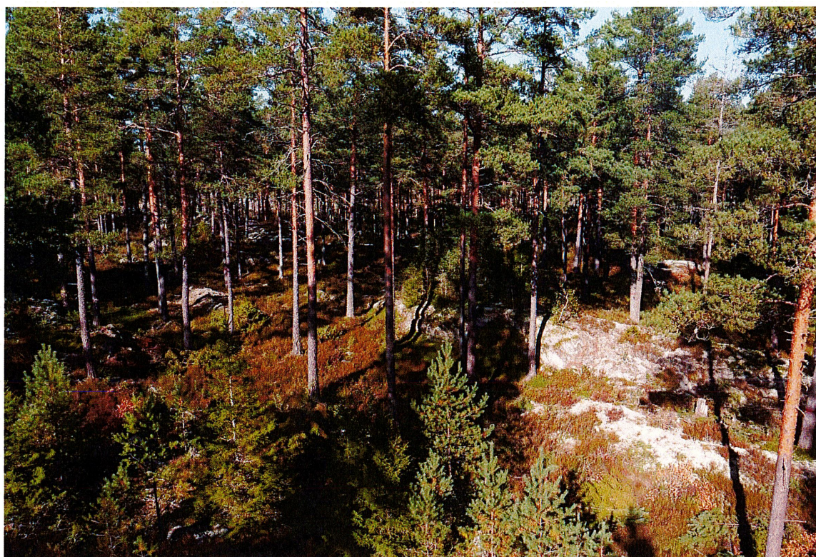
Tallskog hos en Häradsallmanning

För sågverken började året med samma goda konjunktur som året innan. Priserna för sågade trävaror var bra och leveranserna goda. När kriget bröt ut kom en förväntan i Europa att det skulle uppstå en brist på trävaror när de ryska varorna skulle bojkottas. Köparna började köpa på sig trävaror för att inte stå utan. Allt eftersom kriget fortled och inflationen började bita sig fast, påbörjades räntehöjningar runt om i världen i syfte att bromsa inflationen. Med stigande räntor under året har bostadsbyggandet bromsat in i Europa. Och med det har konjunkturen för sågverken försämrats under året.